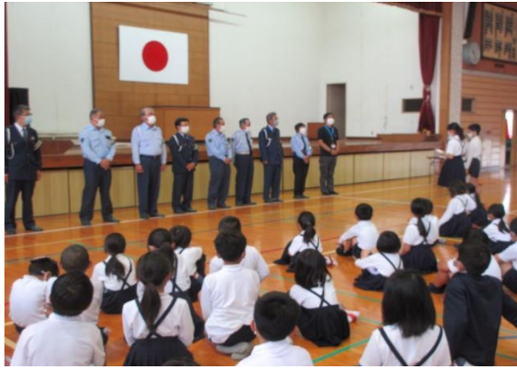
【児童代表がお礼の言葉を述べました】