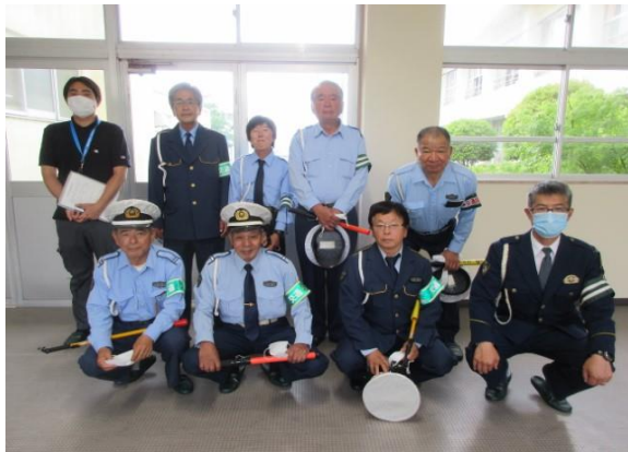
【交通教室で御指導いただいた皆様】

また、いつも登校の見守りをいただいている交通指導員の皆様を紹介し、児童の代表が感謝の言葉をお伝えしました。多くの方々に見守っていただいていることに心より感謝いたします。